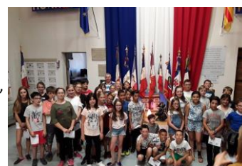
CM2 au centre de mémoire à Perpignan