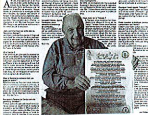
De 14 au 20 avril 2021. Hommage. Le Semaine du Rouillon N°1288 23